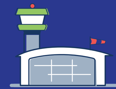
Puntos de control de seguridad del aeropuerto Airport security checkpoints

REAL ID will affect access to places controlled by the federal government.