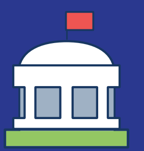
Edificios federales seguros (como instalaciones militares) Secure federal buildings (like military facilities)